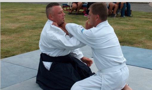
Journée des associations Liffré – 2004