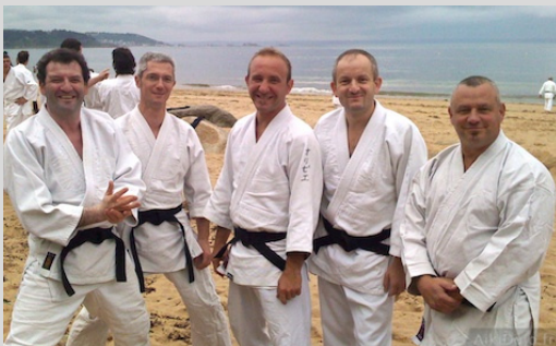
Inter-Dojos – Lannion 2012