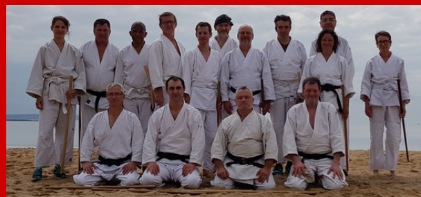
Inter-dojos Lannion - 2018

Des rencontres inter-dojos ont lieu au cours de chaque saison, afin de pratiquer sous la direction de divers enseignants.